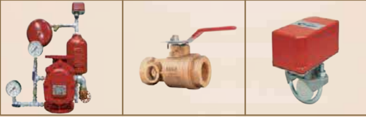
ISLAK ALARM VANASI